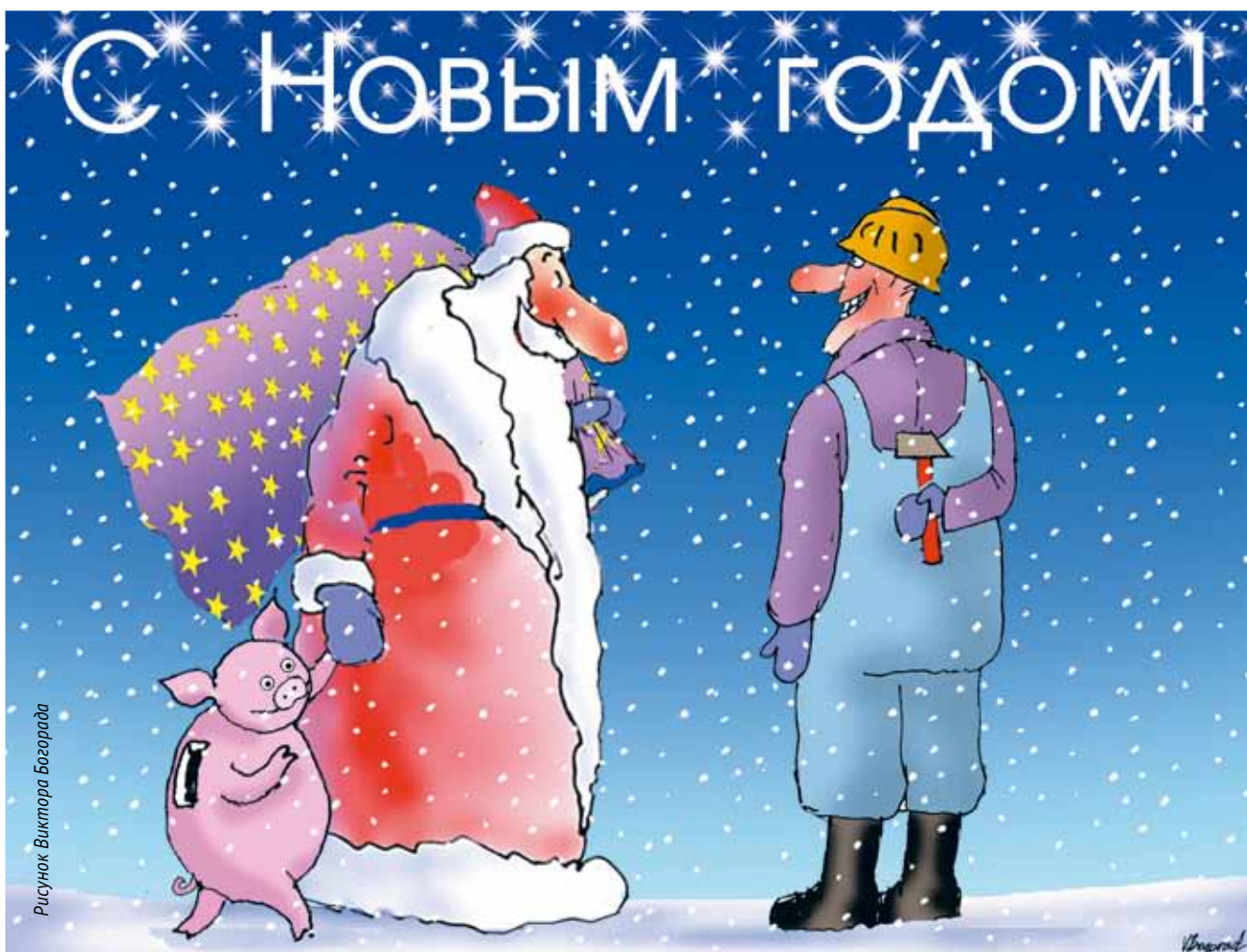
Рисунок Виктора Богорада

Н ам всё время нужны новые умения. Вчерашние знания оказываются бесполезными. Чему полезному вы научились за этот год? Какие навыки и компетенции освоили? Может быть, прошли личностный тренинг, выучили ещё какой-нибудь иностранный язык или освоили вязание, стали уверенным пользователем каких-то полезных компьютерных программ? А может, вы теперь умеете ориентироваться в лесу без навигатора и разводить костёр с одной спички? Как вы считаете, какие умения понадобятся в первую очередь, чтобы без потерь (а лучше – с пользой) пережить надвигающийся год Свиньи? (А он, конечно же, обещает быть не менее интересным!)